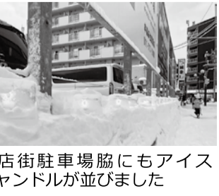
商店街駐車場脇にもアイスキャンデルが並びました