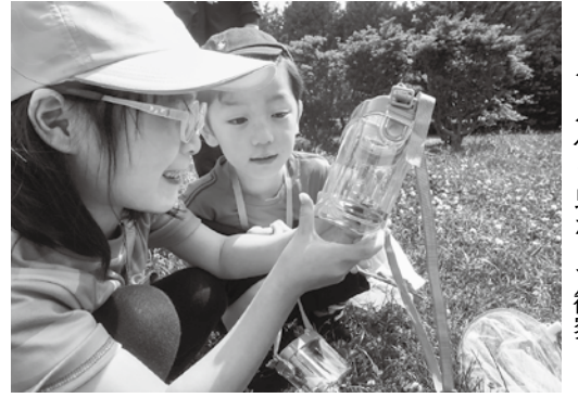
ルーペ付き虫かごで観察

1.小学生26人を含む43人が参加しました。晴天に恵まれたこの日、最高気温は26度。育成委員から虫かごとスケッチブックを贈ら