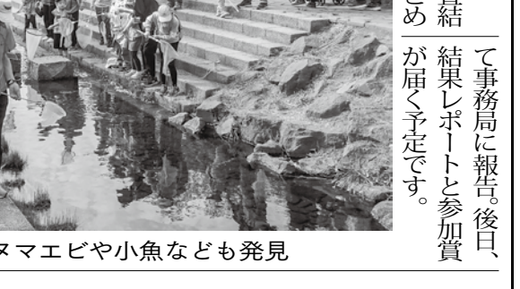
安春川ではヌマエビや小魚なども発見