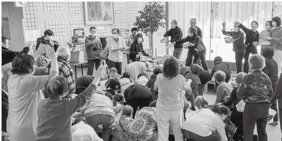
豆をまく人も受ける人も大はしゃぎ。皆さんに「福」が訪れますように…

実は木原館長もたつ年生まれ。「見て、見て、こんなにと取れた」と笑顔の人々を見て、「今年子どもたちの参加もあってにぎやか。豆も昨年より多い8キを用意しましたが、あつという間に無くなりました」と喜んでいました。